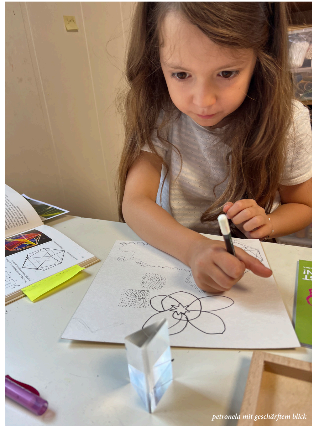
petronela mit geschärftem blick

das ferien camp im winter leitet selina ziegler. sie wohnt in kärnten (österreich) und reist extra für die bildstill*-kinder in die schweiz.